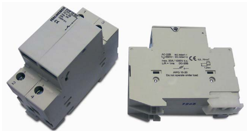
Foto del prodotto / Product image