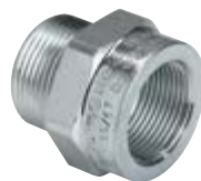
Ρακόρ αερίου/μετρικά από γαλβανισμένο χάλυβα για συνδέσεις σωλήνα/κουτιού IP67