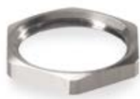
Παξιμάδια από επινικελωμένο ορείχαλκο με μετρικό σπείρωμα