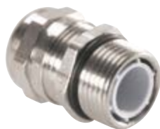
Στυπιοθλίπτες από επινικελωμένο ορείχαλκο με μετρικό σπείρωμα IP66/IP68