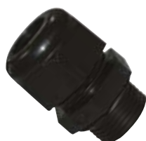
Στυπιοθλίπτες από μονωτικό υλικό με μακρύ μετρικό σπείρωμα IP66/IP68