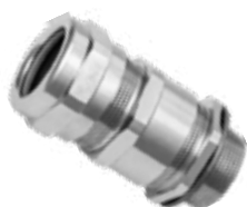
Στυπιοθλίπτες για οπλισμένα καλώδια από επινικελωμένο ορείχαλκο με μετρικό σπείρωμα IP66/IP68