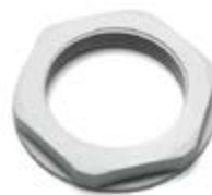
Παξιμάδια από μονωτικό υλικό με μετρικό σπείρωμα