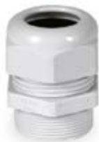
Στυπιοθλίπτες από μονωτικό υλικό με μετρικό σπείρωμα IP68