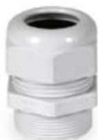
Στυπιοθλίπτες από μονωτικό υλικό με μακρύ μετρικό σπείρωμα IP68