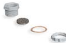
Πώματα στεγάνωσης με φίλτρο συμπυκνωμάτων και σπείρωμα Pg IP54