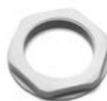
Παξιμάδια από μονωτικό υλικό με μετρικό σπείρωμα