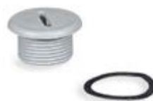
Πώματα από μονωτικό υλικό με σπείρωμα Pg IP67